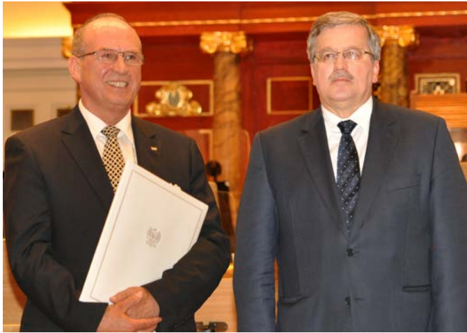
Uroczystość wręczenia najbardziej prestiżowej Nagrody Gospodarczej Prezydenta RP przez Bronisława Komorowskiego (2011) w kategorii „Innowacyjność”.

System DERO to osiągnięcie powstałe dzięki szerokiej współpracy badawczo-rozwojowej i praktyce chirurgicznej prowadzonej w systemie konsorcjalnym z wieloma wybitnymi ośrodkami i specjalistami z kraju i zagranicy. Wspólne działania realizowane z Polskim Towarzystwem Chirurgii Kręgosłupa i Stowarzyszeniem Studiów i Badań Kręgosłupa (wcześniej Polska Grupa DERO) od lat stanowią fundament rozwoju polskich metod chirurgicznego leczenia schorzeń kręgosłupa. Firma LfC bardzo ceni sobie wkład polskich chirurgów, którzy nie tylko są znakomitymi lekarzami-praktykami, ale potrafią także dostrzec potencjał najnowszych technologii medycznych i z wielkim zaangażowaniem współuczestniczą w ich rozwoju i upowszechnianiu.